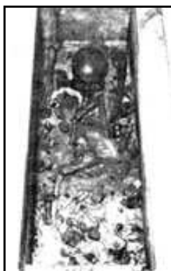
Мощи свт. Николая Мирликийского после вскрытия саркофага в базилике города Бари

Для того, чтобы провести анатомо-антропологические исследования святых мощей вскрыта была гробница в Бари. Экспертизу делал профессор Луиджи Мартино. В результате