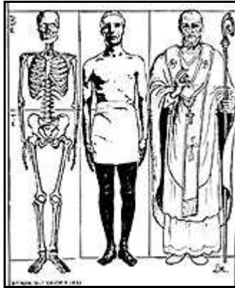
По строению скелета был воссоздан точный рост святого Чудотворца

расе, для которой характерны средне-высокий рост и смуглая кожа. Определены рост святого Угодника (167 сантиметров) и комплекция – с высоким лбом, с носом, стремящимся к орлиному, скелетом средней крепости. Антропологическое исследование мощей свидетельствует о том, что Мирликийский Архиепископ не ел мяса, а употреблял только растительную пищу.